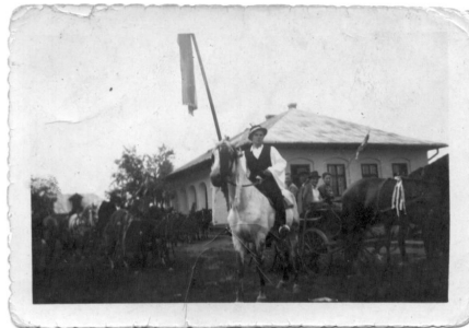
Pünkösdi király fehér lovon (1955)

Ha megfigyeljük a „ király asszony ültetés ” szokását, láthatjuk, hogy eredetileg termékenység varázsló rítussal van dolgunk, ahol is egy „ fa bábót hordoznak, szépen felöltöztetve virágok, koszorúk s koronával feldíszítve ” amivel a házakhoz érve, azt felemelve – mintegy analógiás mágiaként alkalmazva – az eljövendő termésre mondanak jókívánásokat.