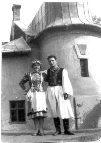
Pütkösdí király és királyné (1955. október 25. Rókahát)

A név eredeti jelentéstartamára azonban még találhatunk olyan adatokat, melyek az ünnep fokozatos átalakulása során is megőrizte annak termékenységvarázsló jellegét. A széles csípőt mindenesetben a termékenység jelképének tekintették és éppen ezért a királyasszony táncmulatságok alkalmával is: – „ Némely asszony sárga bundát kötött maga alá, hogy minél kövérebb legyen. ” 14 A királyasszony táncmulatság termékenységgel kapcsolatos voltát mutatja az is, hogy az ünnephez kapcsolódó táncot minden esetben nő kezdte meg, 15 holott – az akkori táncrend általános jellemzőjeként – az ilyen táncvigalmak mindig férfitáncsal kezdődtek. 16